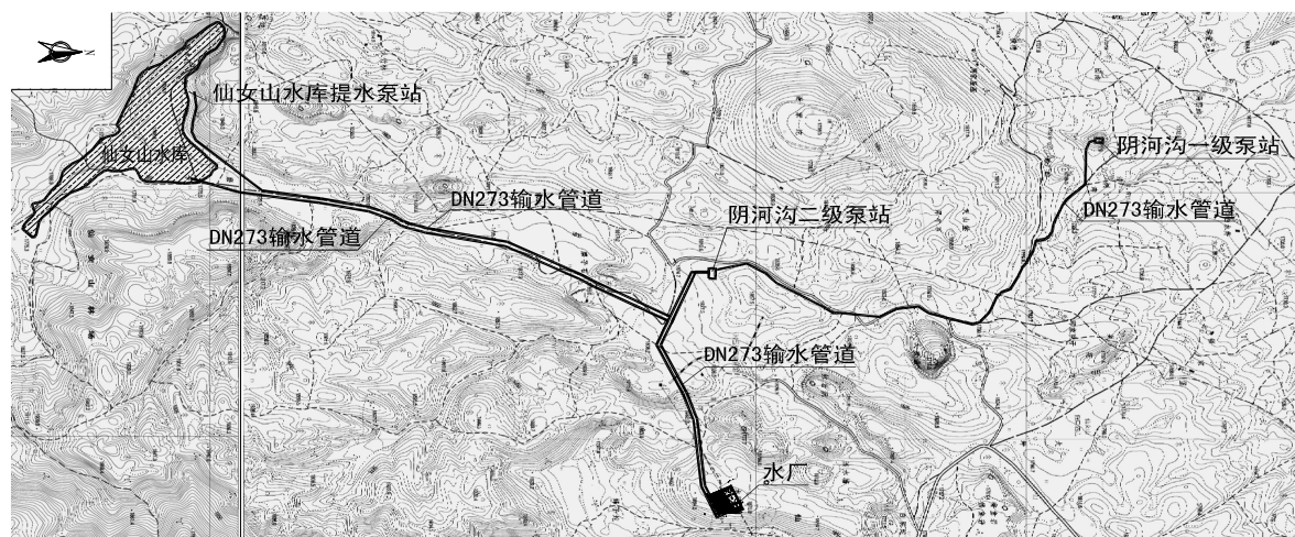
图 1 仙女山抗旱应急水源连通工程引水供水管线布置示意图

仙女山抗旱应急水源连通工程的主要功能为从阴河沟提水向水厂供水，在满足水厂需水的前提下，多余水量经二级泵站调节池自流进入水库，在阴河沟提水水量不满足水厂需求时，由仙女山水库向水厂补充供水，其任务和功能与仙女山水库的阴河沟引水系统以及水库至水厂供水系统部分相同，但引水供水规模小于仙女山水库工程。